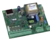
578D Плата управления