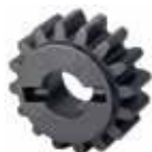
Зубчатое колесо Z16