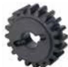
Зубчатое колесо Z20